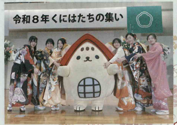
▼昨年度くにはたちの集いの様子