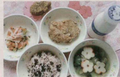
●中学校給食・入学進級お祝い献立 鶏肉の唐揚げ