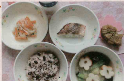
●小学校給食・進級お祝い献立 赤魚の粕漬焼き

炊き込み赤飯(胡麻塩)・花麩味噌汁・紅白なます風サラダ・ おめでたい焼き・低温殺菌牛乳