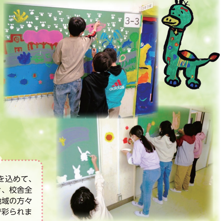
教育総務課 教育施設担当 (内)325

改築工事を行っていた第二小学校の新校舎が12月中に竣工予定です。冬休み中に引越しを行い、3学期に新しい校舎での学校生活がスタートします。今後も新しい体育館の建設やグラウンドの整備を行ってまいります。