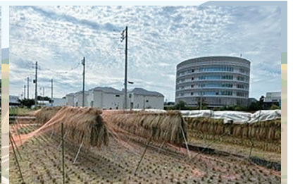
教育指導支援課 (内)336