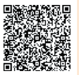
↑くにはたちの集い(旧成人式)詳細ページ