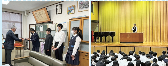
教育指導支援課(内)331

令和7年度、創立50周年を迎える国立第三中学校。生徒が主体的に参加し、意見表明する場を大切にしながら、教育活動をまた一歩前進させています。