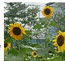
ひまわりプロジェクトのひまわり