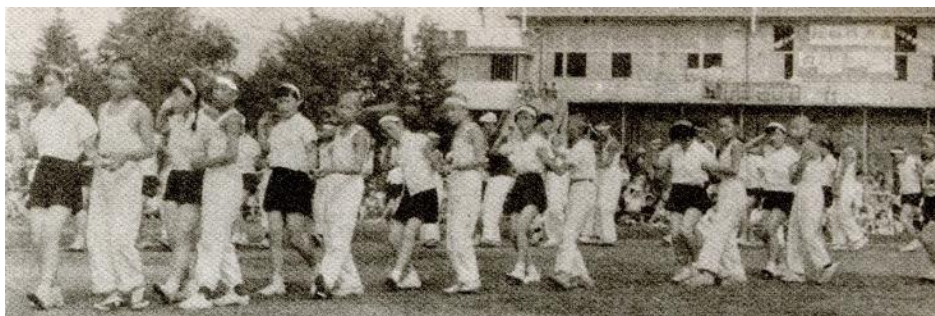
在りし日の運動会の様子・フォークダンス

夕べはるかす 武蔵野の 丘みはるかす 時計台 正しくつよく 美しき ゆくてしめして 今日鳴る 国立二中 ああわれら