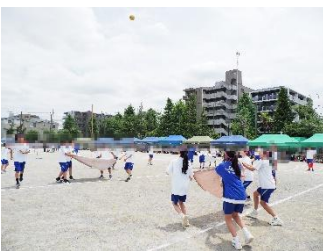
エネルギー×コア 2年