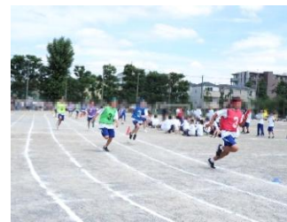
男女混合 学級対抗リレー