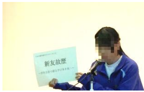
5月15日 朝礼での 実行委員長の挨拶

1日目は東京駅を予定通り出発し、興福寺を見学した後、奈良公園内を班別行動しました。2日目は京都市内を電車やバスを乗り継ぎながらまわり、夜には能楽体験（能の鑑賞）を行いました。生徒による能の実演もあり大いに盛り上がりました。3日目はタクシーによる京都市内の班別行動でした。運転手さんの案内で楽しくまわることができました。班ごとに京都・奈良をまわり、先人が築いてきた文化や伝統（京都・奈良の故歴）に直に触れるだけでなく、外国の方と接することで異文化に対する理解を深めるきっかけにもなりました。宿舎では、普段は見られない仲間の違った面に触れるなど、交流を深めることができました。3日間天候にも恵まれ、クラス替えした新しい級友と京都・奈良をまわり「学年全員で創る学び多き修学旅行」となりました。