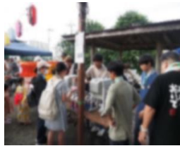
矢川いこいの広場 (青柳中央会)

青柳中央会、三和会、富士見台3丁目、富士見台4丁目、西の会の5自治会が主催する夏まつりに、延べ、1年生29名、2年生6名、3年生42名、計77名の生徒が、「ボランティア」として参加し、地域の方に感謝されました。参加した生徒の皆さん、このような機会を提供して下さった地域の皆様ありがとうございました。