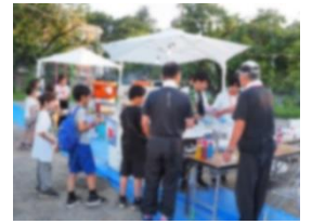
国立二小校庭 (西の会)