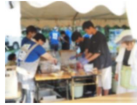
矢川上公園 (富士見台四丁目)