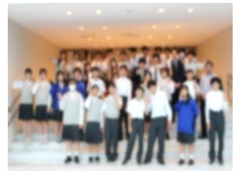
合唱コンクール実行委員会