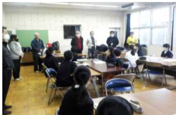
花育み委員会と市役所の皆様