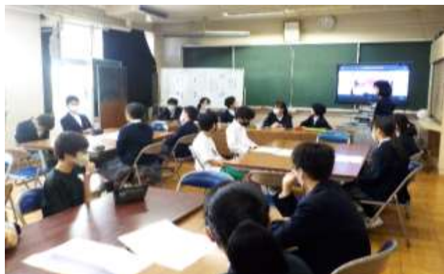
グループに別れてデザインについての話し合い

期末試験最終日の11月18日（水）には、一中花壇の整備活動があります。今回集まってくれたボランティアの人たちが、これから一中を支えてくれる頼もしい存在となって地域に貢献してくれることを期待しています。