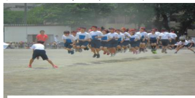
(体育大会学年種目写真)

一方で、施設や人的対応力等の環境整備、教職員の特別支援教育についての更なる力量の向上等、実施上の課題があることも事実であり、すべてのニーズに応えられないこともあります。そのときは真摯に相談させていただきながら、できるところから進めて参ります。また国立市教育委員会においても、文部科学省の指定を受け「インクルーシブ教育システム構築」モデル事業を推進しており、平成27年度の重点課題のひとつとして「『交流及び共同学習』の推進」を掲げ取り組んでいるところです。