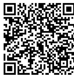
国立第六小学校の 教育に関するアンケート

※教育課程の編成……教育目標を達成するために行う様々な教育活動の計画。カリキュラム編成。 (各教科・道徳・生活指導・委員会等の特別活動・六小タイム・行事予定・授業時間数などの計画)