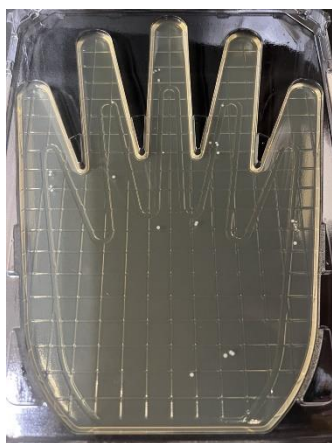
【石けんで洗った手】