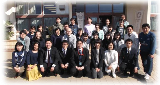
4月2日(火) 正面玄関にて

本日より、平成31年度が始まりました。校庭に咲く彩り鮮やかなチューリップが、児童一人一人の新たな門出を祝うように咲き誇っています。お子様のご入学・ご進級、誠におめでとうございます。今年度は、新1年生77名を迎え、全校児童349名でスタートいたします。