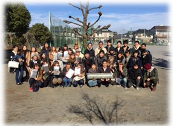
最後の教え子(6年生)が20歳に ～平成29年1月2日～

右の写真は、私が学級担任として受けもった最後の 子供たちです。私は平成21年3月、あきる野市の小 学校で6年生を卒業させると同時に学校現場を離れま した。その際、教え子から「タイムカプセルを埋めて、 20歳になったらみんなで掘り返そう」と声上がり、 8年後に集合したのです。中には、お母さんになっ ている教え子やすでに働いている教え子もいて、立派に 成長した姿に感動したことを覚えています。