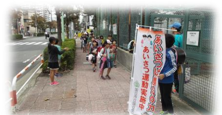
代表委員によるあいさつ運動の様子

あいさつも大切な言葉の一つです。あいさつは相手の存在を認め、大切にしようとする意味があります。また、人と人が出会い、出会った人同士が互いに心を開いて相手にせまっていくために交わす最初の言葉であり、これから始まるコミュニケーションの重要な一歩になります。今後も、あいさつを含めた「言葉」を大切にしながら学校づくりを進めてまいります。